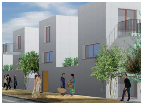
Projet de la Nantaise d'Habitations

Ce sont des immeubles réalisés sous la forme de petits plots, d'environ 15 logements. Leur hauteur est généralement limitée à 3 à 4 étages sur rez-de-chaussée.