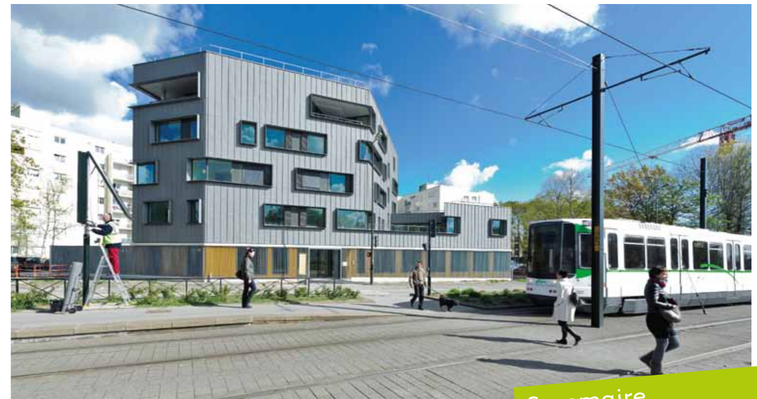
La transformation et la construction d'équipements publics accompagnent le programme de rénovation du quartier : services sociaux, groupe scolaire, voirie, culture. L'ouverture du pôle social du Conseil général en est une illustration.

À Bout-des-Landes/Bruyères, l'actualité de ce début d'année est marquée par l'ouverture du pôle social du Conseil général et le démarrage de la construction de 55 logements à l'angle de la rue de la Chapelle et de la rue de Pont-Aven. Les travaux sur les espaces publics se poursuivent. Cet été, le quartier dévoilera un nouveau visage.