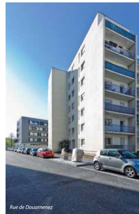
Rue de Douarnenez

Les travaux se sont terminés, simultanément à la livraison du bâtiment du Conseil général. Les murets aux abords des 2-4-6-7 sont en cours de finition. Les accès aux parkings sont maintenus. La liaison piétonne dans le bois est finalisée et éclairée. Elle offre un second accès aux bâtiments grâce aux halls traversants.