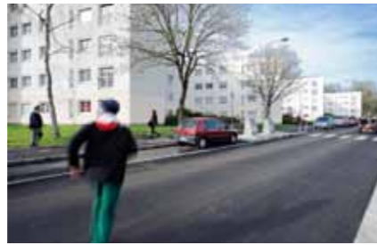
Rue de Pont-Aven