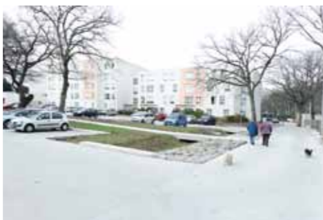
Parking rue de Concarneau