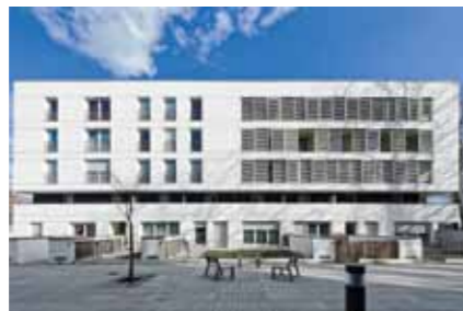
Opération Albert Londres : 40 logements sociaux livrés par Nantes Habitat en 2011