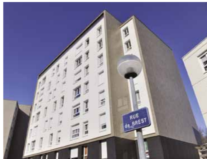
La réhabilitation des immeubles Nantes Habitat au 2, 4, 6 et 8 rue de Brest, est achevée.

La résidentialisation fait partie intégrante d'un projet de rénovation urbaine. Complémentaire des travaux entrepris dans les logements, sur les façades et les parties communes, elle permet de modifier la physionomie d'un quartier et de le tranquilliser. Par différents aménagements, il s'agit de mieux identifier les espaces de vie et de circulation : plantation, clôture, double contrôle d'accès, éclairage, signalétique.