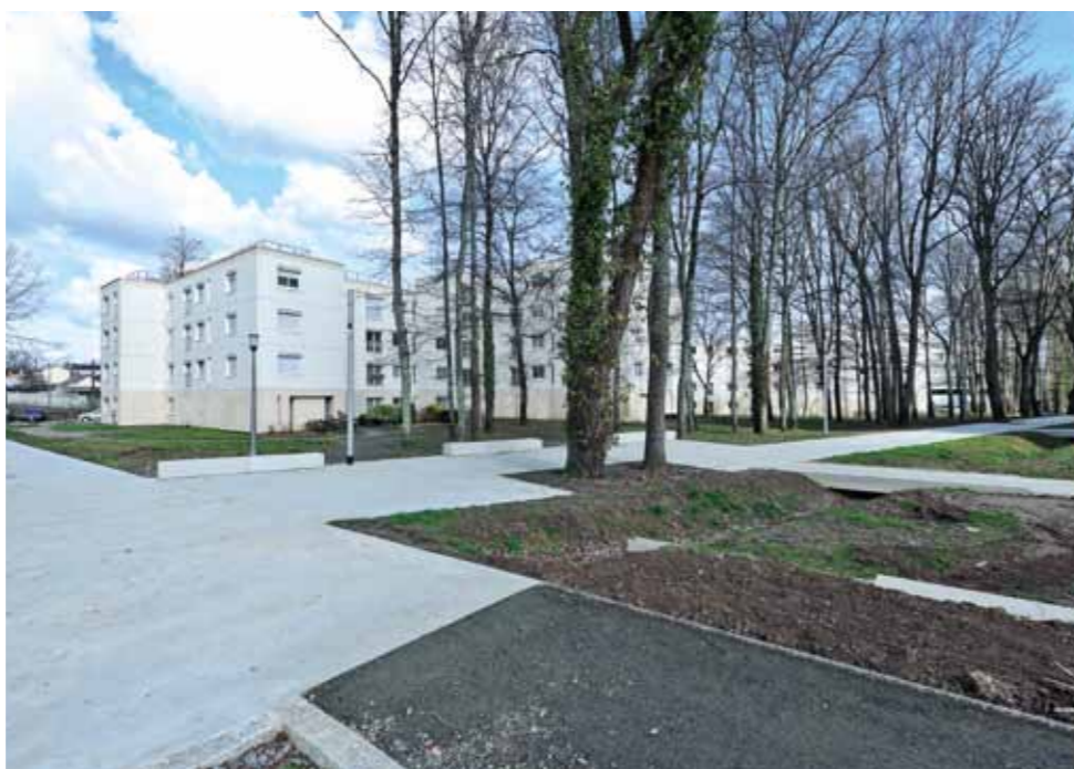
Le mail de Landivisiau en direction de la route de la Chapelle

La rénovation du quartier s'accompagne du réaménagement des espaces verts, de la voirie et des cheminements. Plusieurs chantiers sont en cours sur le quartier. Les rues sont progressivement refaites pour améliorer la circulation intérieure et ouvrir le quartier. Après la rue de Pont-Aven, les abords de l'école (rebaptisés rue de Questembert) ont été aménagés l'été dernier. Une nouvelle liaison piétonne, le mail de Landivisiau, traverse le bois et les nombreuses voiries en cul-de-sac ont été ouvertes. En 2012, la rue de Concarneau et la nouvelle place seront aménagées, la rue de Douarnenez l'est déjà et le square Cassin sera agrandi en 2013.