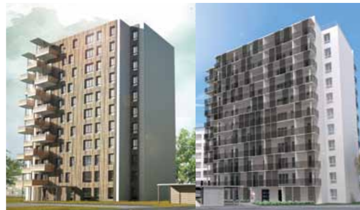
Le projet 10 rue de Brest.

● La deuxième phase de construction démarre sur le quartier. L'occasion de devenir propriétaire à Bout-des-Landes / Bruyères.