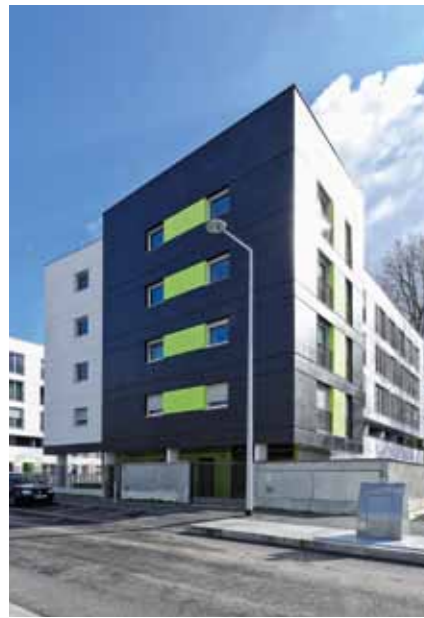
Rue de Pont-Aven