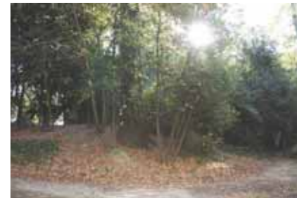
Le parc Say, un espace de loisirs et de promenade pour les habitants du quartier.