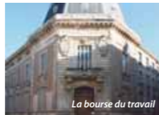
La bourse du travail