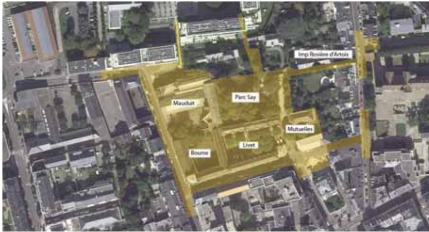
Le périmètre de l'opération

Le site Désiré-Colombe fait partie de ces lieux qui ont profondément marqué l'histoire et la mémoire des Nantais : les fêtes aux Salons Mauduit où se pressait le Tout-Nantes ; les meetings syndicaux emblématiques de l'histoire sociale de la ville... Le projet d'aménagement du site va permettre la réhabilitation et la mise en valeur de ce patrimoine historique du début du siècle dernier.