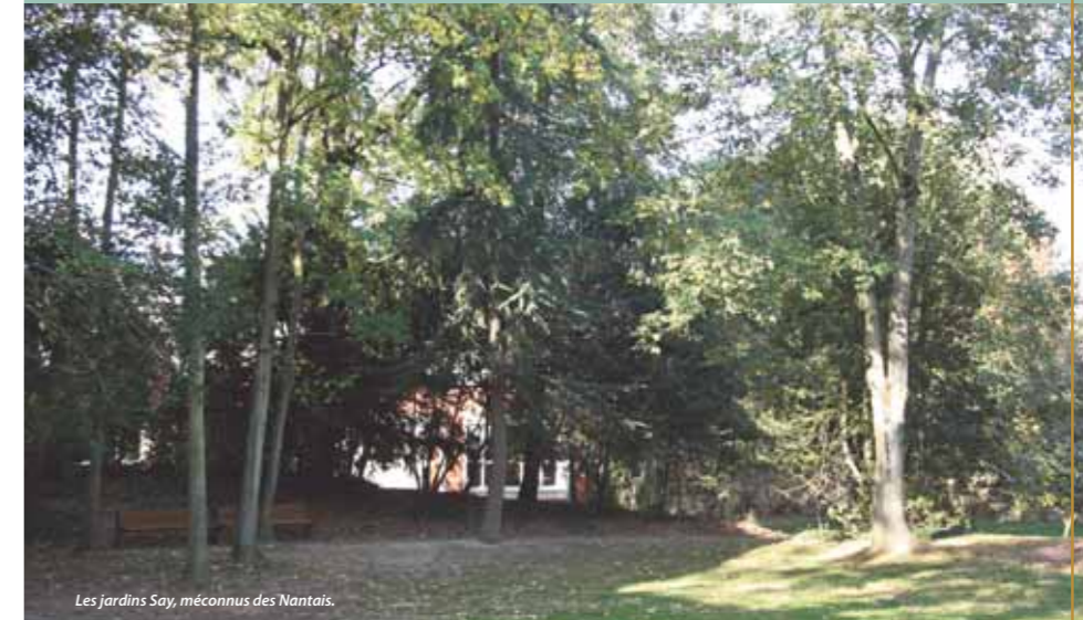
Les jardins Say, méconnus des Nantais.

À l'ouest du centre-ville, le site Desiré-Colombe va faire l'objet d'un grand projet de renouvellement urbain.