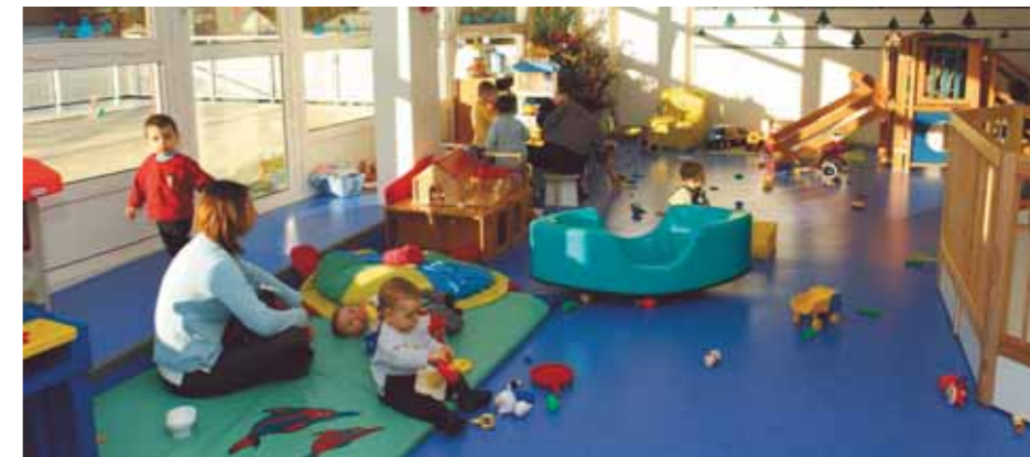
La création d'un multi-accueil de 60 places répondra aux attentes des familles du centre-ville.

Peu connu des Nantais, le parc Say s'étend sur 3000 m 2 . Le projet prévoit d'ouvrir cet espace boisé remarquable aux habitants et aux associations du quartier. Plusieurs aménagements sont prévus : restauration des boisements ; création d'un espace de convivialité avec jeux pour enfants ; espaces partagés à imaginer avec les habitants.