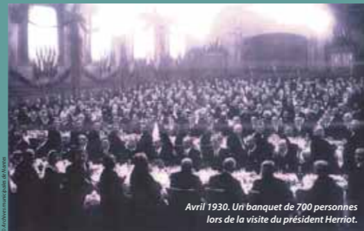
Avril 1930. Un banquet de 700 personnes lors de la visite du président Herriot.