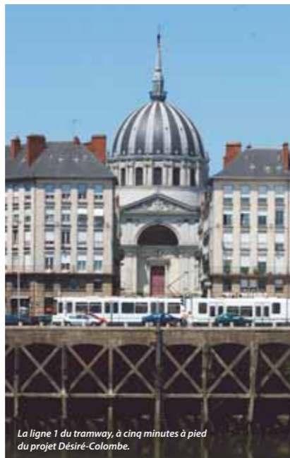
La ligne 1 du tramway, à cinq minutes à pied du projet Desiré-Colombe.