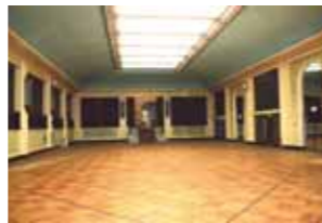
Le grand Salon Mauduit accueillera à nouveau fêtes et événements.

Reconstruit à l'identique dans le prolongement du pôle associatif, le grand Salon Mauduit retrouvera sa vocation de lieu de fête et d'événement. D'une capacité d'accueil de 300 à 400 personnes, il permettra la tenue de conférences, l'organisation d'événements associatifs et institutionnels, de fêtes de quartier et de fêtes familiales. Il sera équipé d'une scène, de loges et d'un espace traiteur. Sa conception acoustique permettra de respecter la tranquillité du voisinage.