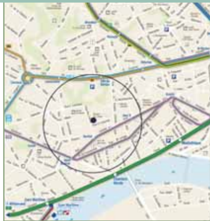
Quatre offres de transports publics à proximité pour faciliter la mobilité des riverains.