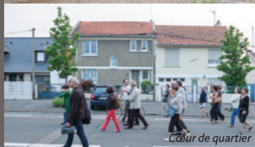
Cœur de quartier

Le quartier dispose de nombreuses qualités. Lors de la réunion publique, première étape de la concertation, les participants ont pu re-découvrir le secteur et ses différentes identités afin de mieux appréhender les potentiels du quartier et les enjeux du projet.