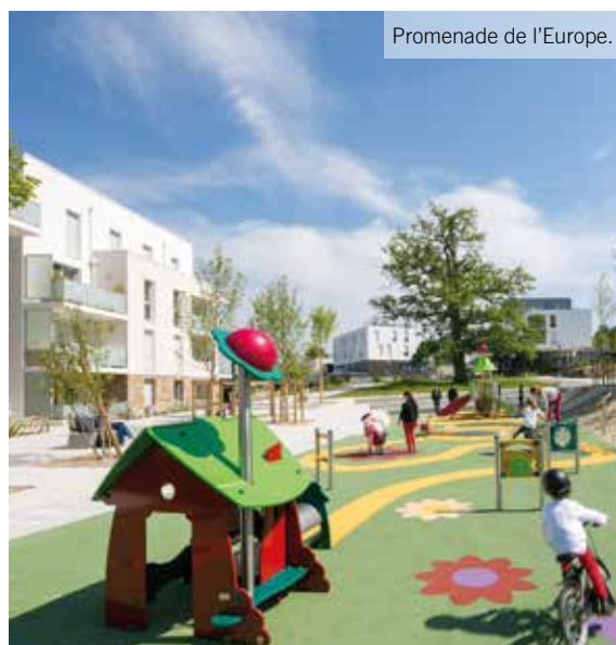
Promenade de l'Europe.