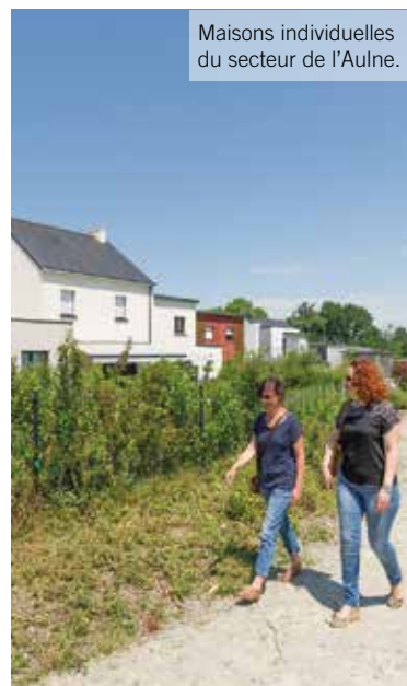
Maisons individuelles du secteur de l'Aulne.