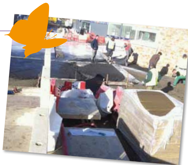
Un chantier de l'entreprise Charier

Nantes Métropole développe une politique volontariste en matière d'insertion par l'activité économique sur son territoire. La Direction de l'innovation intervient auprès de 36 donneurs d'ordre, collectivités de la communauté, entreprises publiques sociales, bailleurs sociaux ainsi que RFF et la SNCF, tenus d'intégrer dans leurs marchés de travaux des clauses d'insertion, soit un minimum d'heures, de 5 à 50% en fonction du marché, (généralement 5 à 10% pour les travaux). Le bilan est positif, avec des objectifs remplis à 126% , preuve que les entreprises jouent bien le jeu. Le système a ainsi permis, sur le territoire, 48% d'accès à l'emploi et à un contrat de travail pour les demandeurs inscrits dans le dispositif.