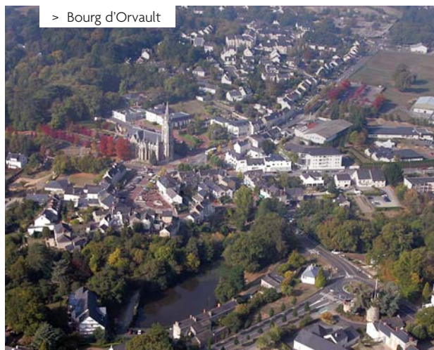
> Bourg d'Orvault

Avec cette lettre, "Info Garettes", la ville d'Orvault vous propose un outil d'information sur l'élaboration et l'évolution du projet de Z.A.C. du Vallon des Garettes. Jusqu'à la livraison complète de la Z.A.C., la municipalité vous donnera ainsi rendez-vous pour vous faire part des avancées du dossier.