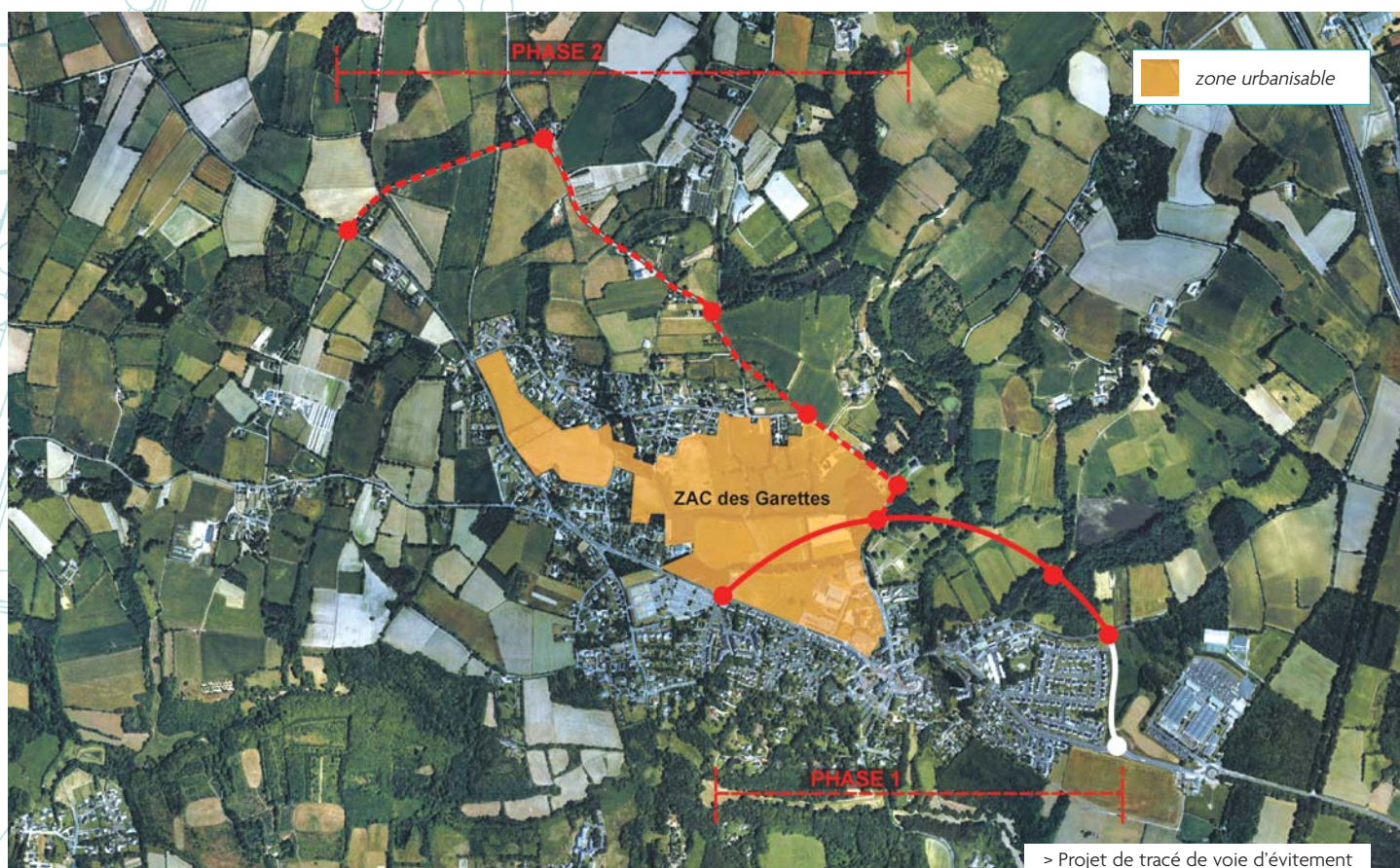
> Projet de tracé de voie d'évitement