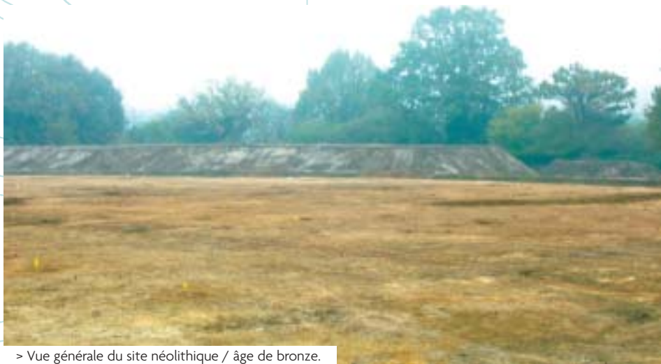
> Vue générale du site néolithique / âge de bronze.