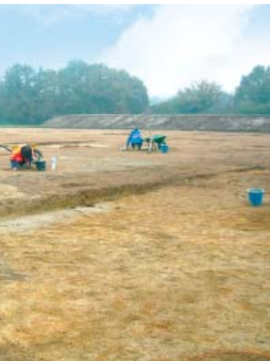
> Site néolithique / âge de bronze : en cours de fouille.