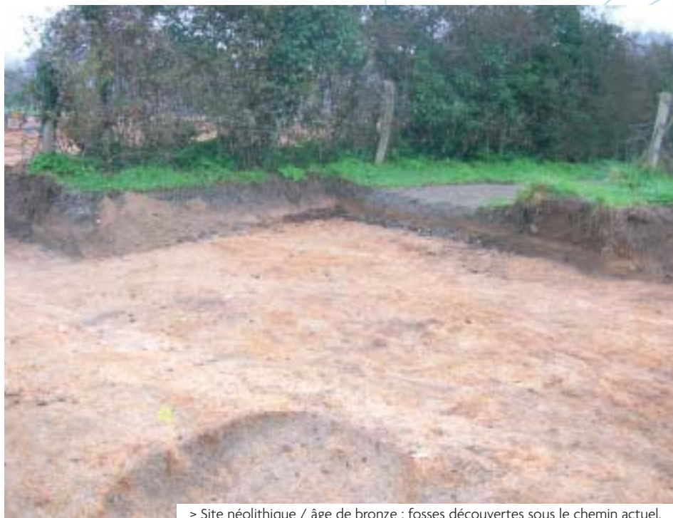
> Site néolithique / âge de bronze : fosses découvertes sous le chemin actuel.

des haches par exemple, des objets en fer, mais aussi la présence d'éléments architecturaux, comme le torchis ou des tuiles, qui permettent également de faciliter les datations.