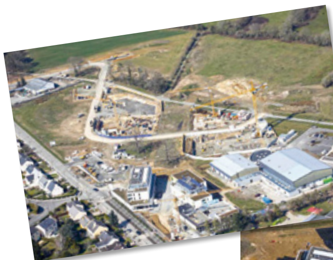
Photos aériennes prises en mars 2012