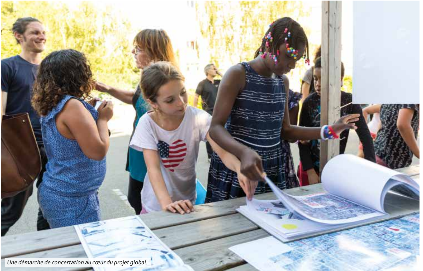
Une démarche de concertation au cœur du projet global.