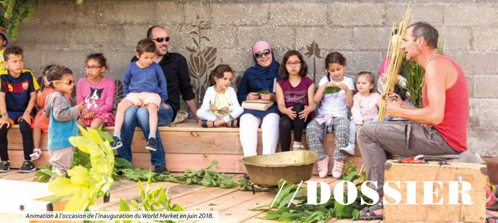
Animation à l'occasion de l'inauguration du World Market en juin 2018.