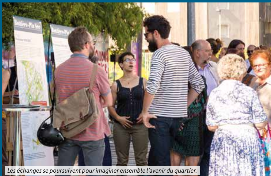
Les échanges se poursuivent pour imaginer ensemble l'avenir du quartier.