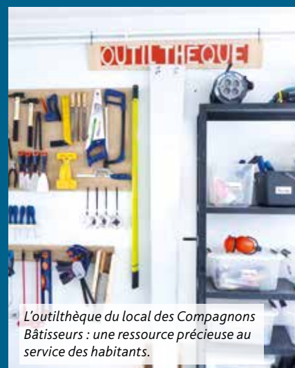
L'outilthèque du local des Compagnons Bâtitisseurs : une ressource précieuse au service des habitants.

Contact : 2 rue de la Basinerie En savoir plus : https://www.compagnonsbatisseurs.eu/