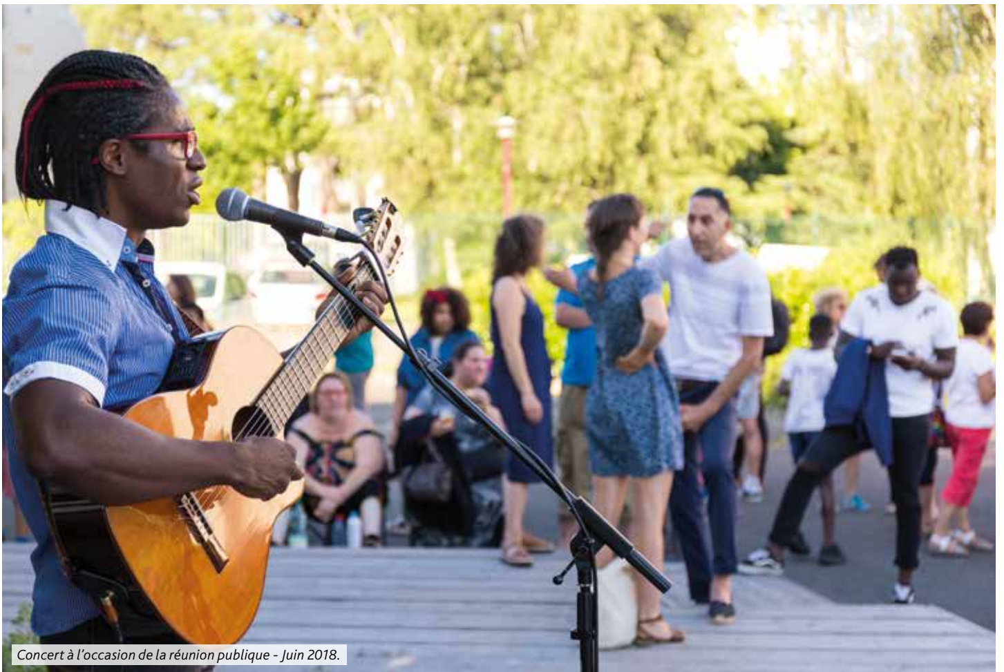
Concert à l'occasion de la réunion publique - Juin 2018.