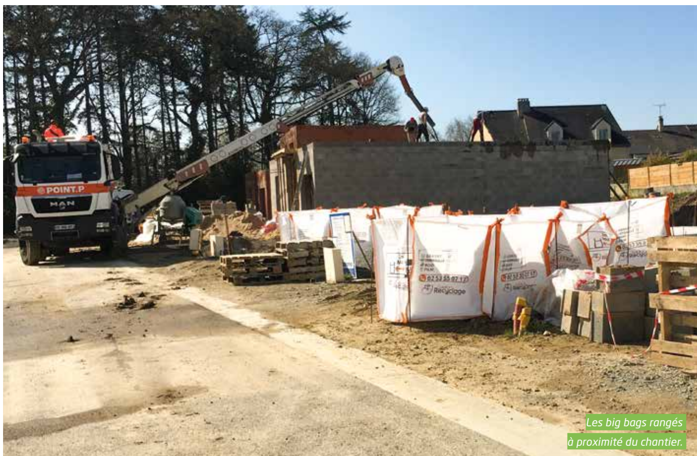
Les big bags rangés à proximité du chantier.

« Il a fallu mettre au point un procédé de collecte à géométrie variable » explique Olivier Humeau, directeur de Solution Recyclage. « Dans la construction d'habitat individuel en effet, chaque cas est différent. Il n'y a pas les mêmes modes constructifs, pas les mêmes déchets, pas les mêmes emballages, pas la même implication des uns et des autres... Le relationnel est également un point important de notre démarche. »