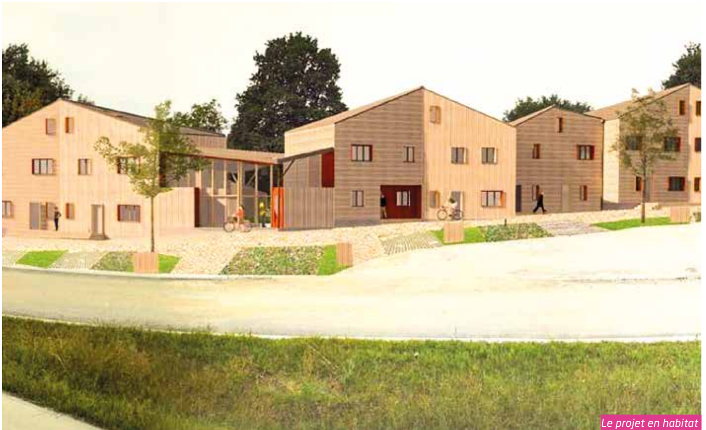
Le projet en habitat participatif "La Mozaïk des Garettes" est composé de maisons à ossature et bardage bois.

En juillet dernier, l'association "La Mozaïk des Garettes" a déposé le permis de construire de son projet d'habitat participatif. Sur un terrain de 4 200 m 2 au cœur de la ZAC, huit maisons individuelles groupées de 80 à 120 m 2 avec jardins privés et partagés seront bientôt construites : « Nous disposerons également de locaux vélos et d'une maison commune avec une salle de vie, du matériel partagé et un atelier bricolage » indique Élise, membre de l'association. « En extérieur, il y aura un grand jardin avec des espaces verts, un potager, peut-être un poulailler, mais qui restent à créer... » Fin 2018, accompagnées par le cabinet d'architecte Cartouche sélectionné par l'association, les familles ont planché sur leur projet : localisation des différents espaces, cheminements,