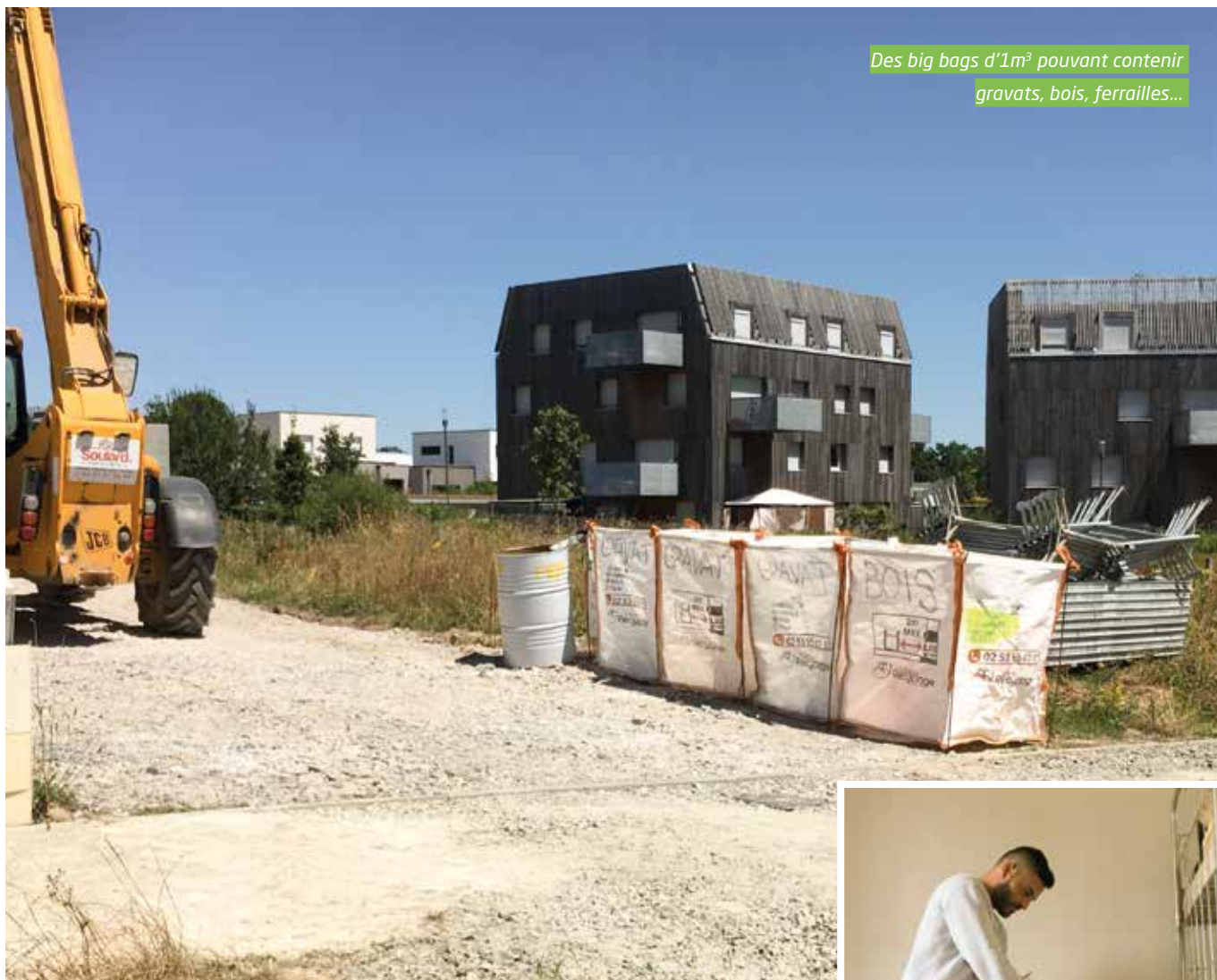
Des big bags d'1m 3 pouvant contenir gravats, bois, ferrailles...