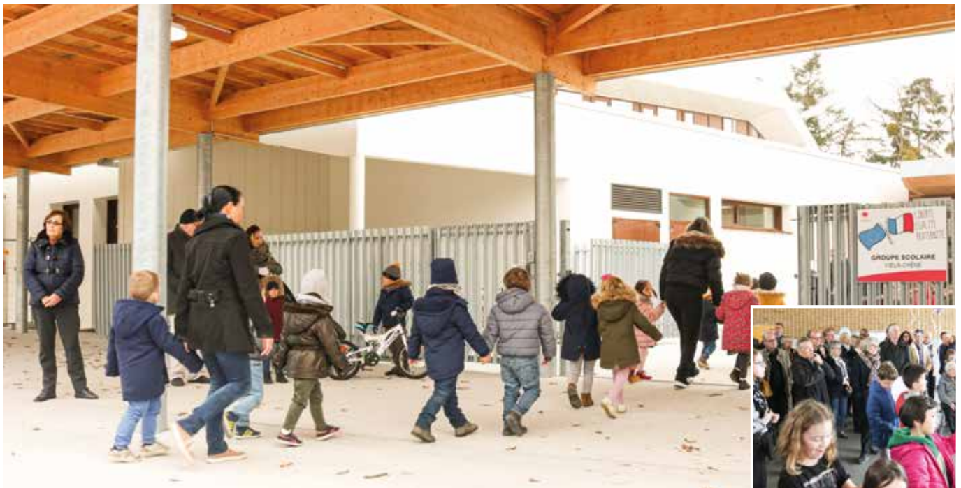
Inauguration de l'école du Vieux-Chêne.

Coralie, maman d'un élève en CE2 renchérit : « L'école est à la fois plus accessible, plus facile et plus accueillante. Avec moins de bruit également, les enfants sont plus au calme. Mon fils s'y retrouve beaucoup mieux ! » À l'extérieur, un parvis permet l'échange entre les parents, mais aussi la liaison piétonne avec la rue du Raffineau.