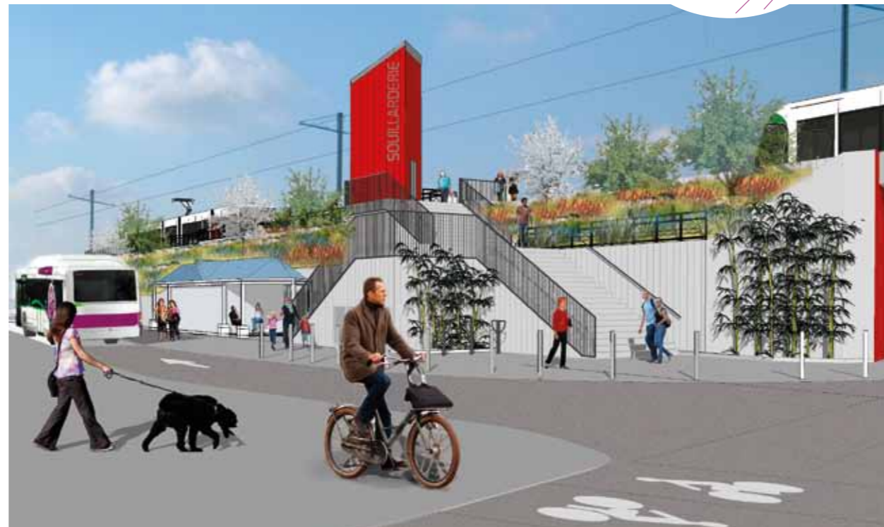
Terminus Souillarderie, des échanges multimodaux plus simples et plus rapides.

Début des travaux le 15 octobre, sur les secteurs station Souillarderie et section rue du Perray / porte de Sainte-Luce. Fin des travaux : septembre 2013.