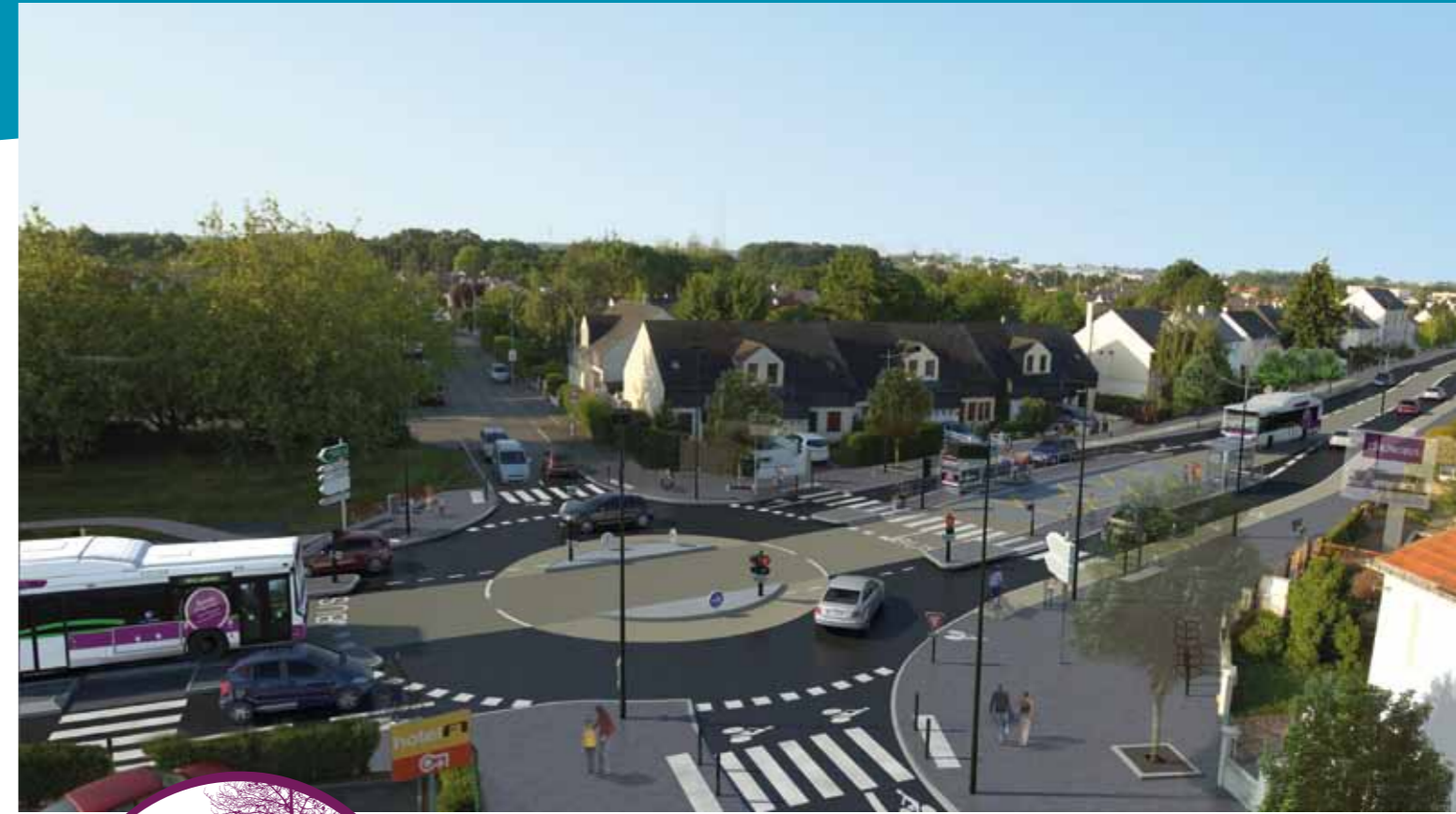
Route de Sainte-Luce, une voie centrale réservée au Chronobus.