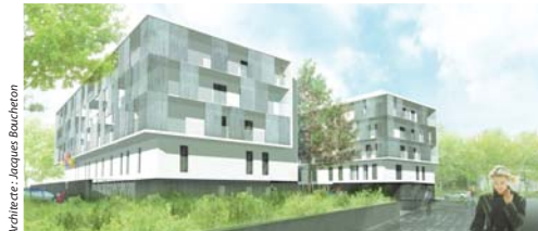
Architecte: Jacques Bourcheton / La Cour Cassin

Le programme de constructions neuves de la SNI débutera en 2011 Dans le contexte de crise, la Société Nationale Immobilière a repris le programme prévu par Aiguillon, ce qui a généré du retard. 55 logements dont 27 en accession abordable et 28 en locatif libre sont prévus.