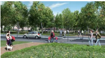
Liaison rue de Concarneau / rue de Pont-Aven

Sur chaque secteur, en lien avec Nantes Habitat, des affiches dans les halls d'immeubles informeront les habitants de l'évolution des chantiers. À l'échelle du quartier, des réunions d'information par secteur seront organisées suivant les besoins avec les habitants.