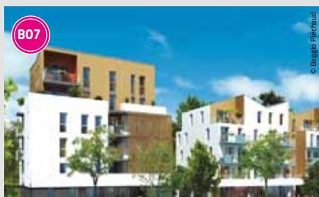
98 logements intermédiaires, collectifs et individuels en accessions libre et abordable. Livraison : fin 2013