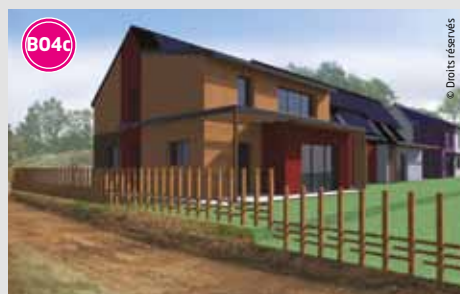
Escapades 9 logements en accession abordable et libre. Habitat Coopératif. Livraison : 2014