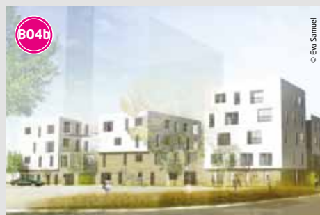
36 logements en accession sociale et abordable. Livraison : 2014