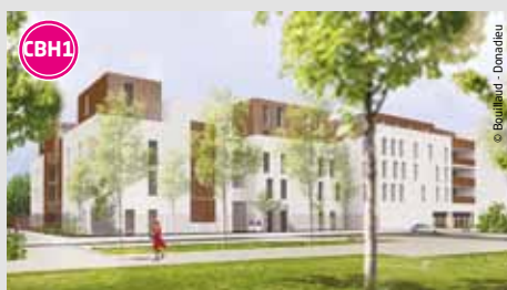
Les Régates 45 logements sociaux en collectif, intermédiaire et individuel et des locaux d'activités en rez-dechaussée. Livraison : 2013