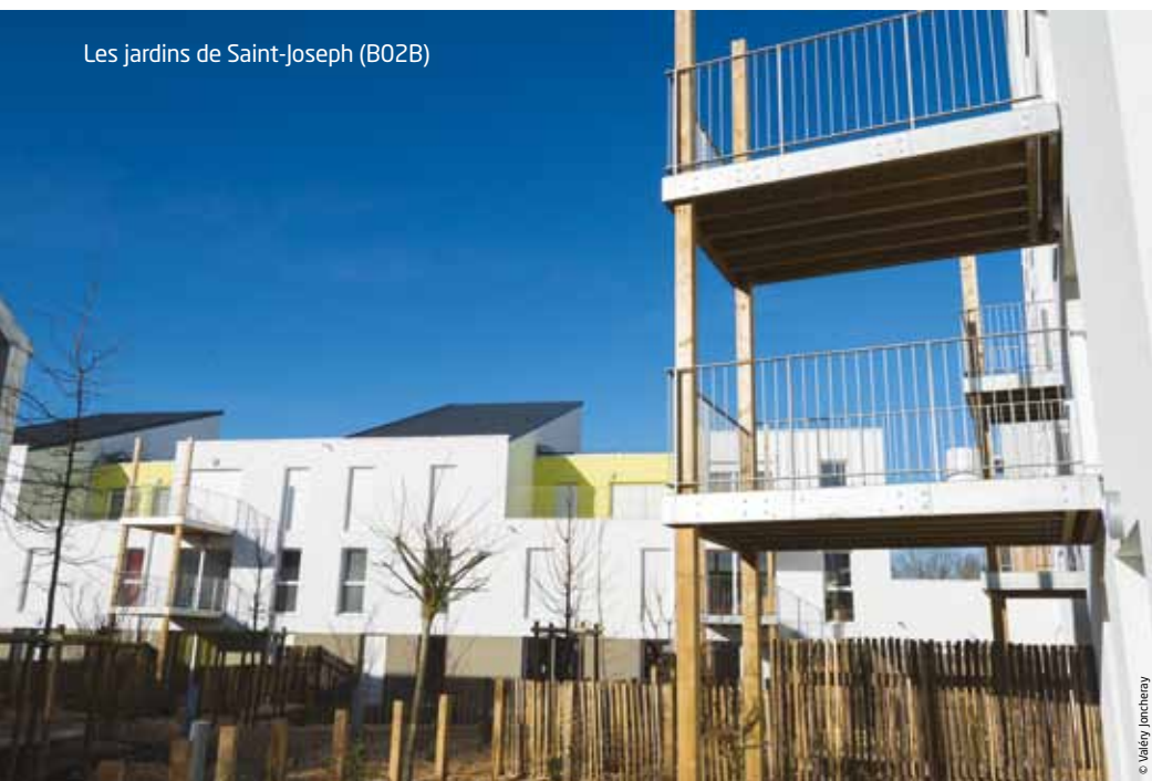
Les jardins de Saint-Joseph (B02B)