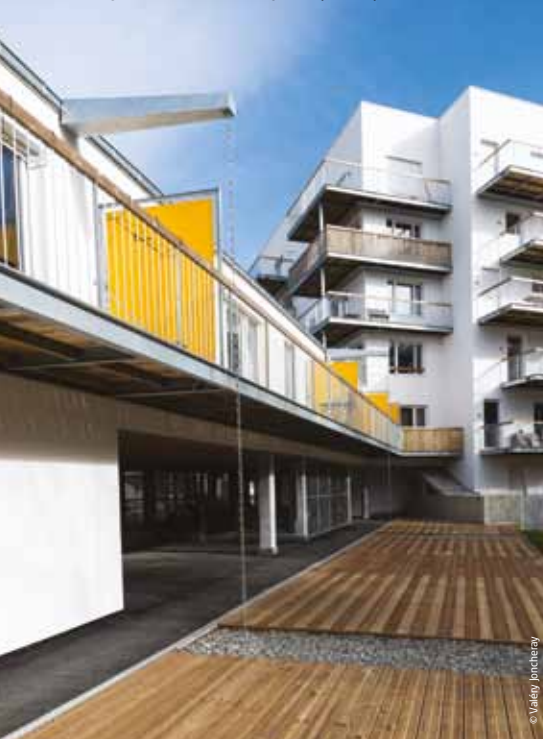
Les jardins de la Beaujoire (BCT1)

Erdre Porterie va connaître de nombreux changements dans les trois années à venir.