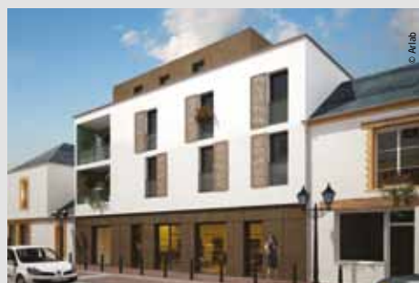
29 logements en accession libre. Livraison : 2014