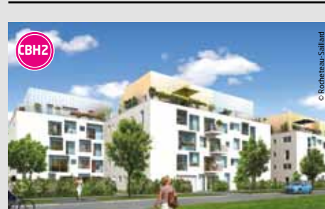
Erdrea 55 logements en accession libre et abordable. Livraison : livré début 2013