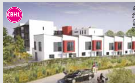
Les Patios de l'Erdre 53 logements collectifs et individuels en accessions abordable et libre. Livraison : début 2013