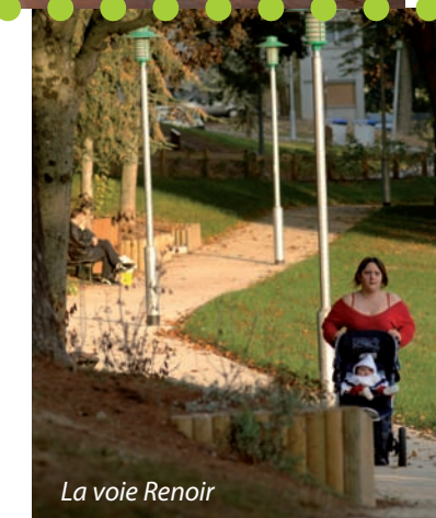
La voie Renoir