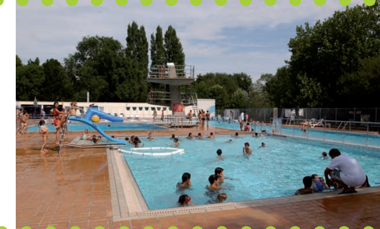
La piscine des « Dervallières »