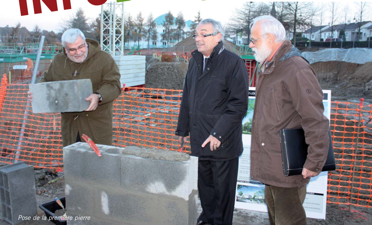
Pose de la première pierre