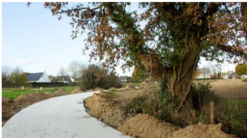
Chemin du Prébigeon

En arpentant la promenade de l'Europe, on aperçoit d'un côté des chênes, très présents sur l'ensemble de la commune, de l'autre, des magnolias et, dans le verger, des pommiers « chailleux », une variété ancienne de la région très résistante aux parasites. De manière plus générale, le choix des plantations s'est porté sur des espèces locales, peu gourmandes en eau, résistantes et demandant un entretien mesuré.