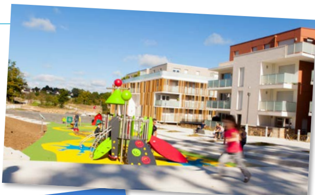
L'aire de jeux

Les chênes qui la bordent sur sa partie gauche et les magnolias sur le versant droit ont été plantés en novembre. L'utilisation de matériaux de la région (pavés d'ardoise, pierres sèches que l'on retrouve au socle des immeubles) et le choix d'espèces végétales indigènes (le chêne, mais aussi les pommiers du verger, de variétés anciennes, originaires de la région : chailleux, fil jaune...) caractérisent l'aménagement de la promenade et affirment l'ancrage régional du lieu.