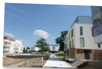
Perspective en juillet