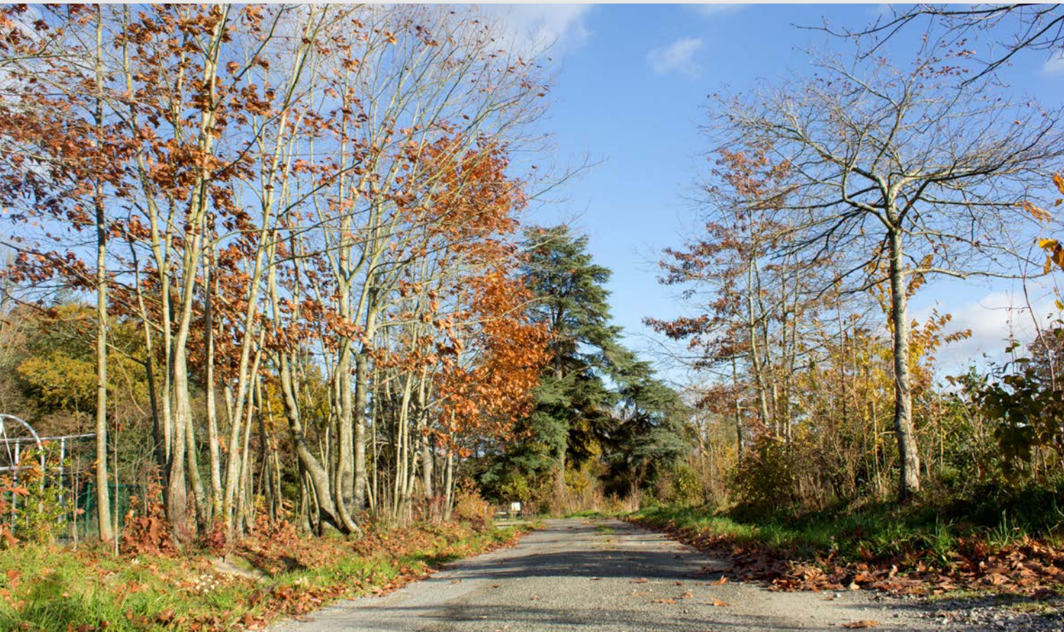
Chemin des Garettes