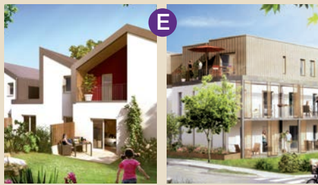
Maître d'Ouvrage : SAMO-Bati Nantes

Résidence comprenant 4 petits collectifs de un étage plus attique ainsi que 6 maisons en accession avec jardin et garage.