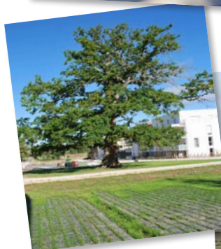
Le grand Chêne