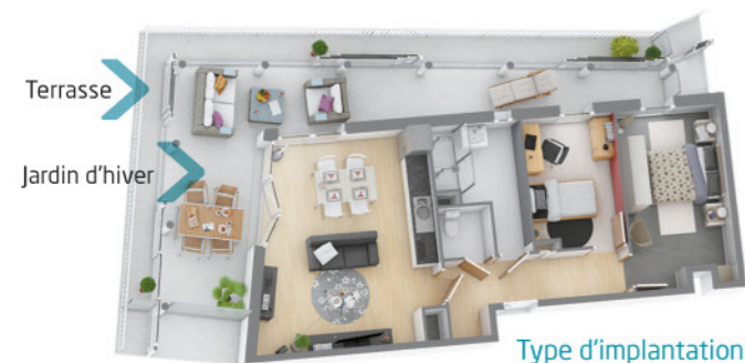
Type d'implantation appartement T3