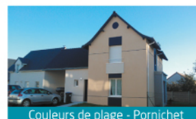
Couleurs de plage - Pornichet

Depuis un siècle, les coopératives ont livré plus de 4500 logements sur la Loire-Atlantique.