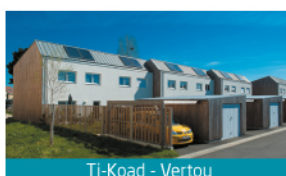
TI-Koad - Vertou

GHT réinvestit l'intégralité de ses résultats dans sa mission d'intérêt général : produire des logements à des prix attractifs, notamment grâce à l'accès à la TVA réduite.