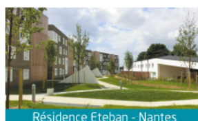
Résidence Éteban - Nantes