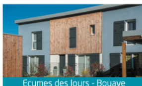
Ecumes des Jours - Bouaye