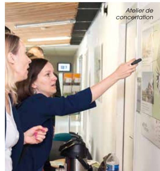
Atelier de concertation

Avec l'arrivée de nouvelles entreprises et activités, « nous devons trouver des solutions pour réguler la circulation et empêcher l'engorgement du site » explique-t-on à Nantes Métropole. La réflexion en cours concerne la circulation automobile, mais aussi les mobilités douces et les transports collectifs. « Une signalétique a été mise en place sur le site pour faciliter le repérage et indiquer notamment la présence de parkings. Nous avons également mis sur pied un atelier