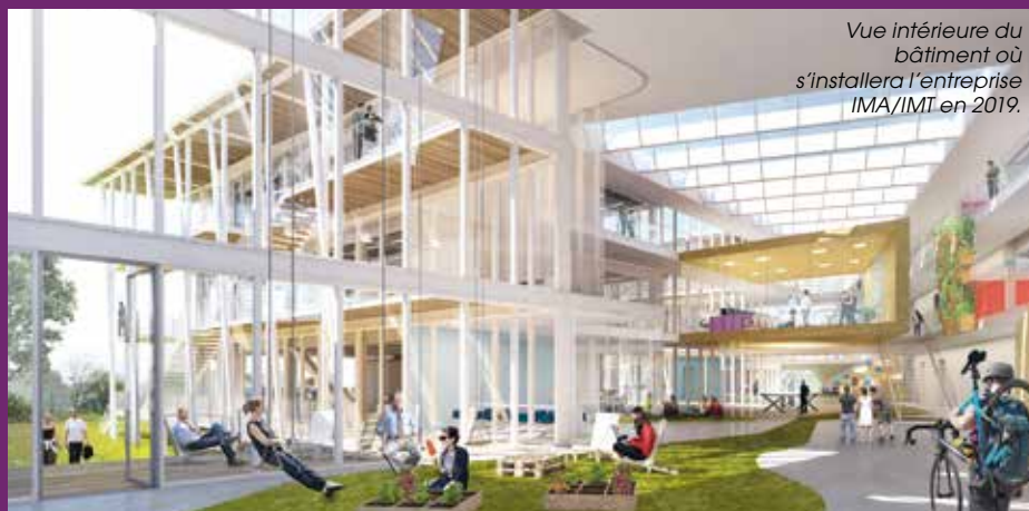
Vue intérieure du bâtiment où s'installera l'entreprise IMA/IMT en 2019.

Fin 2019, ce sera au tour de l'entreprise Eurial, entreprise de transformation du lait et filiale du groupe Agrial, d'emménager sur l'ancien site MHS avec 300 salariés.