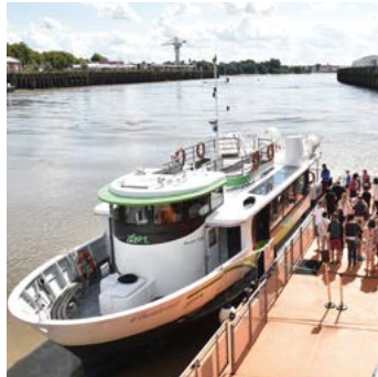
NAVETTE FLUVIALE