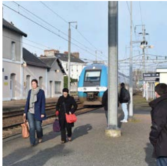
GARE DE CHANTENAY