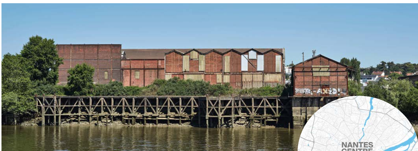
ANCIENNE USINE ÉLECTRIQUE