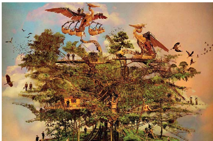
SITE DE LA CARRIÈRE DE CHANTENAY