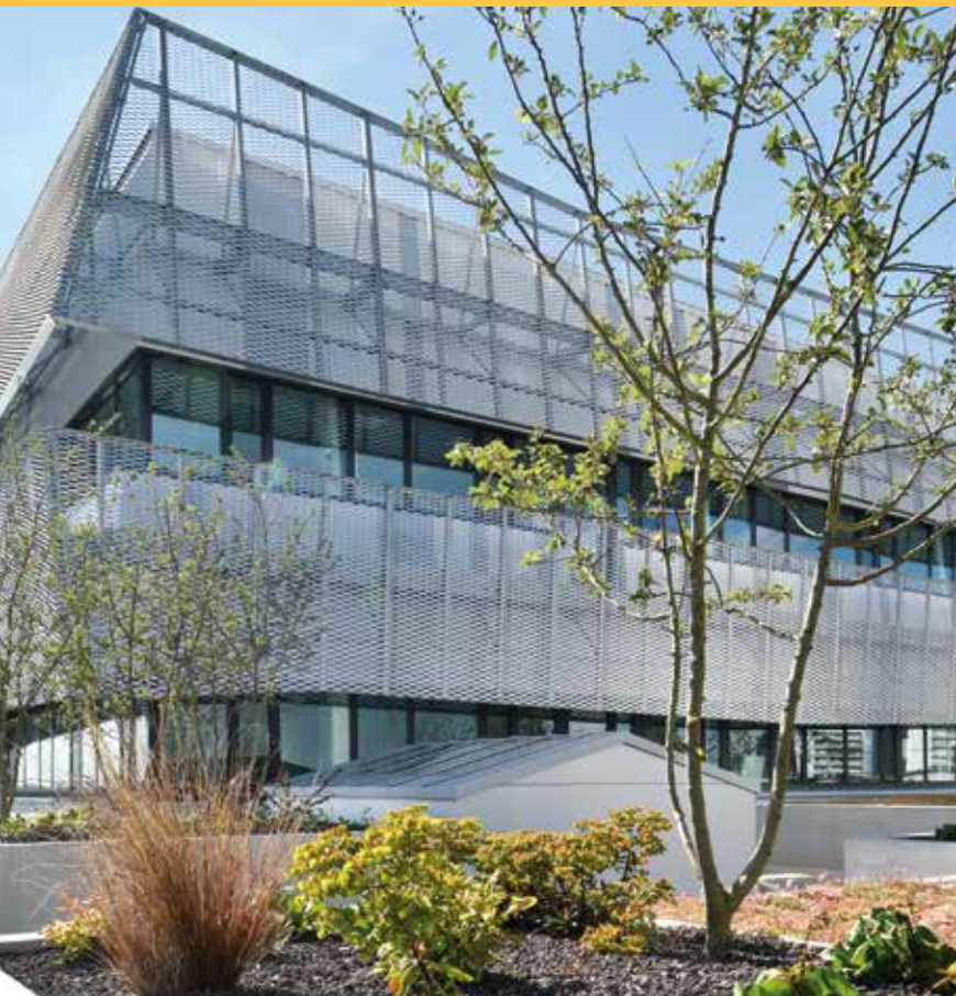
Nantes Biotech est un hôtel d'entreprises de 2 000 m 2 dédié aux biotechnologies, situé à proximité du futur CHU sur l'île de Nantes.

Avec l'arrivée de Pherecydes Pharma, l'immeuble est désormais complet.