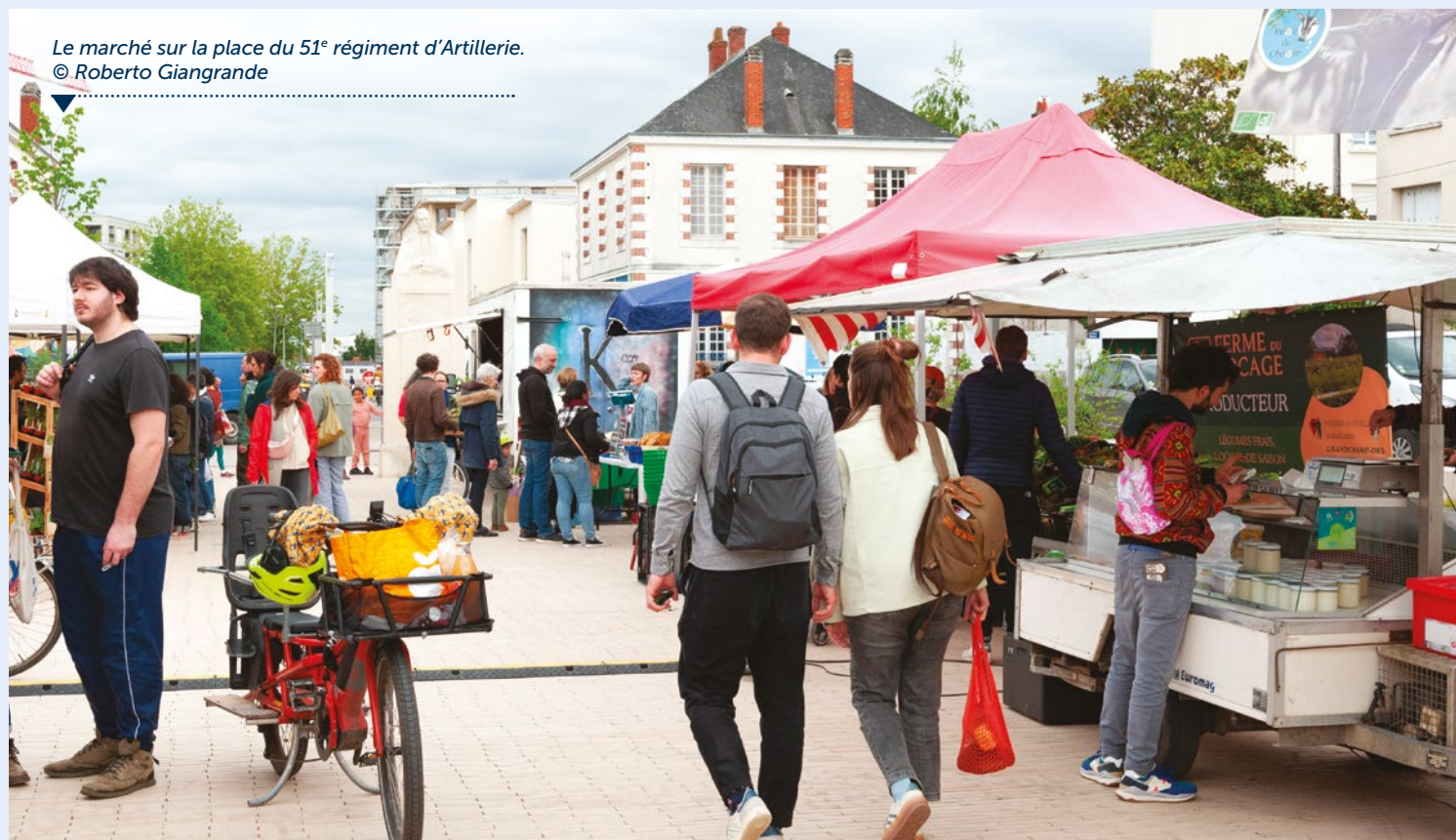
Le marché sur la place du 51 e régiment d'Artillerie.