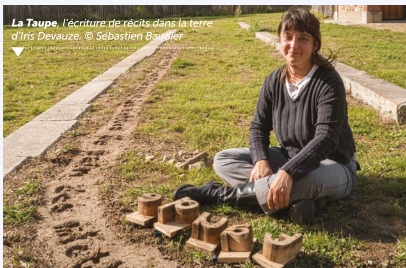
▼ La Taupe , l'écriture de récits dans la terre d'Iris Devauze.