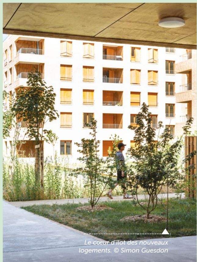
Le cœur d'îlot des nouveaux logements.