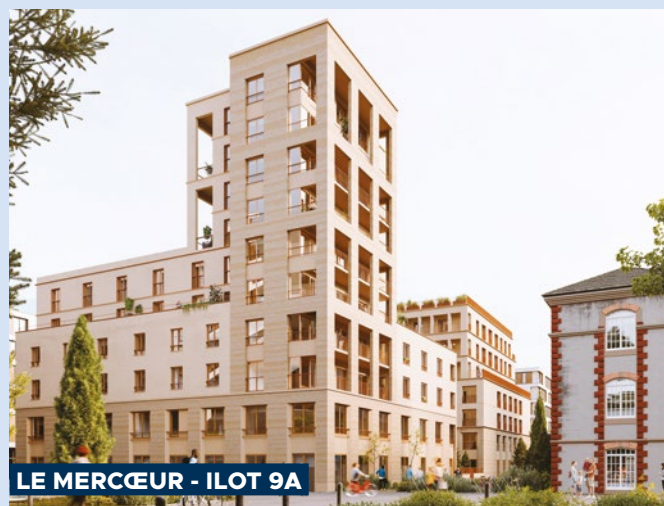
LE MERCEUR - ILOT 9A

5 nouveaux programmes de logements sont prévus au cœur de la Caserne Mellinet, dont 3 sont déjà en chantier. Dans la continuité des logements déjà livrés, ils s'adressent à tous et s'accompagnent de nouveaux locaux d'activités et de commerces.