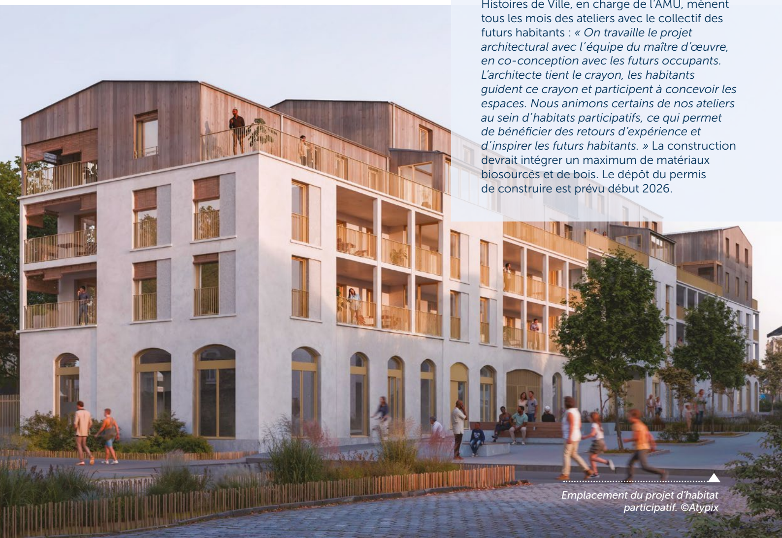
Emplacement du projet d'habitat participatif.

Claas, OmSweetOm environnement et Histoires de Ville, en charge de l'AMU, mènent tous les mois des ateliers avec le collectif des futurs habitants : « On travaille le projet architectural avec l'équipe du maître d'œuvre, en co-conception avec les futurs occupants. L'architecte tient le crayon, les habitants guident ce crayon et participent à concevoir les espaces. Nous animons certains de nos ateliers au sein d'habitats participatifs, ce qui permet de bénéficier des retours d'expérience et d'inspirer les futurs habitants. » La construction devrait intégrer un maximum de matériaux biosourcés et de bois. Le dépôt du permis de construire est prévu début 2026.