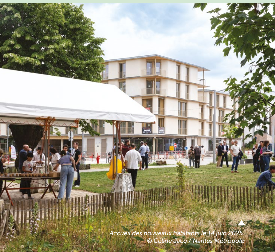
Accueil des nouveaux habitants le 14 juin 2025.

Habiter à la Caserne Mellinet, c'est possible de bien des façons. Parmi les 343 logements livrés en 2025, chacun peut trouver un logement adapté à sa situation : locatif social ou intermédiaires, logement en accession abordable BRS (Bail Réel Solidaire), studios pour les personnes en situation de précarité en pension de famille gérée par Adoma, logements pour les jeunes femmes en difficulté gérés par l'association Anef Ferrer, et logements en accession libre.