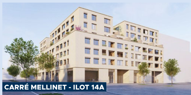
CARRÉ MELLINET - ILOT 14A

Chantier en cours, livraison prévue en 2026.