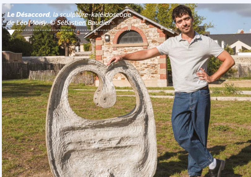
▼ Le Désaccord , la sculpture-kaléidoscope de Léo Moisy.