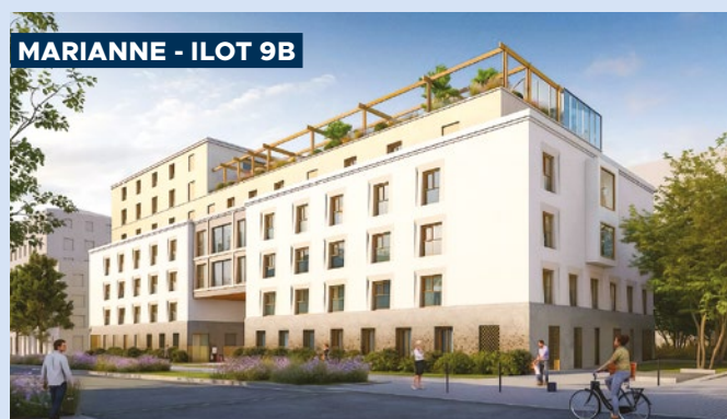
MARIANNE - ILOT 9B

Le Mercœur est lauréat du concours des Pyramides d'Argent 2025 des Pays de Loire, qui distingue les réalisations les plus exemplaires en matière de qualité architecturale, d'innovation, de performance environnementale et d'intégration urbaine.