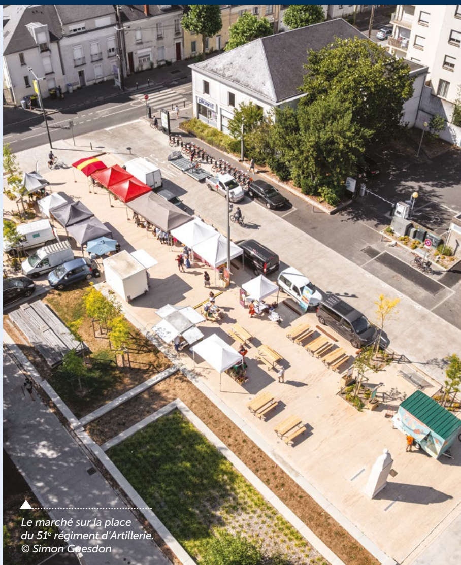
Le marché sur la place du 51 e régiment d'Artillerie.

Plantée de 23 nouveaux arbres, équipée de brumisateurs pour l'été, pavée de briques en terre cuite locale posées sur un lit de sable, elle propose une belle entrée en matière sur le projet urbain de la Caserne Mellinet.