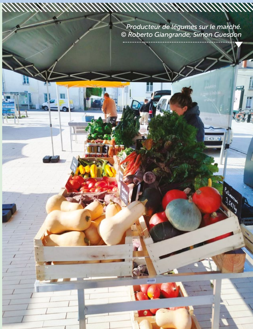
Producteur de légumes sur le marché.