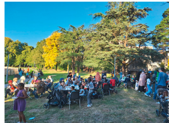
Fête de la ferme urbaine, le 17 septembre 2025

Pour participer aux plantations collectives : 06 59 50 92 94