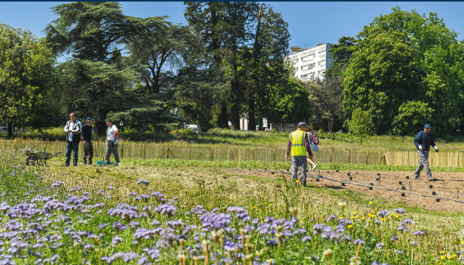
Plantations à la ferme des Dervallières, printemps 2025